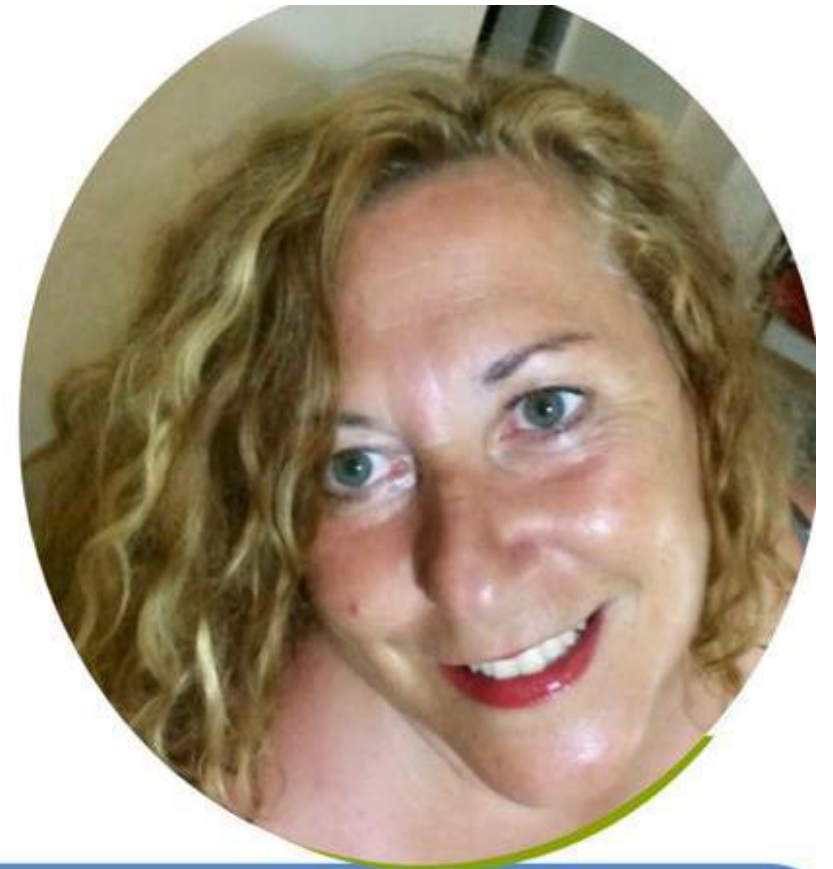
EMILIA MEZZATESTA SCUOLA PRIMARIA

Ho accettato di candidarmi in questa lista perché credo nelle cose umili, ho sempre lottato per il riscatto sociale e la dignità della persona, promuovendone la crescita personale e sociale. Conosco il mondo della scuola paritaria, della scuola pubblica e della cooperazione sociale. Ogni giorno della mia vita dal 1990 l'ho vissuto educando, empatizzando con alunni, colleghi, famiglie, associazioni. Ritengo che la nostra presenza nel mondo del sindacato dei "Grandi" possa fare la differenza. Se sei sfiduciato/a e non ti senti ascoltato/a sappi che tanti docenti sono nella tua stessa condizione. Fai un passo di fiducia, aiutaci a riappropriarci della dignità del ruolo, ormai perso nel tempo.